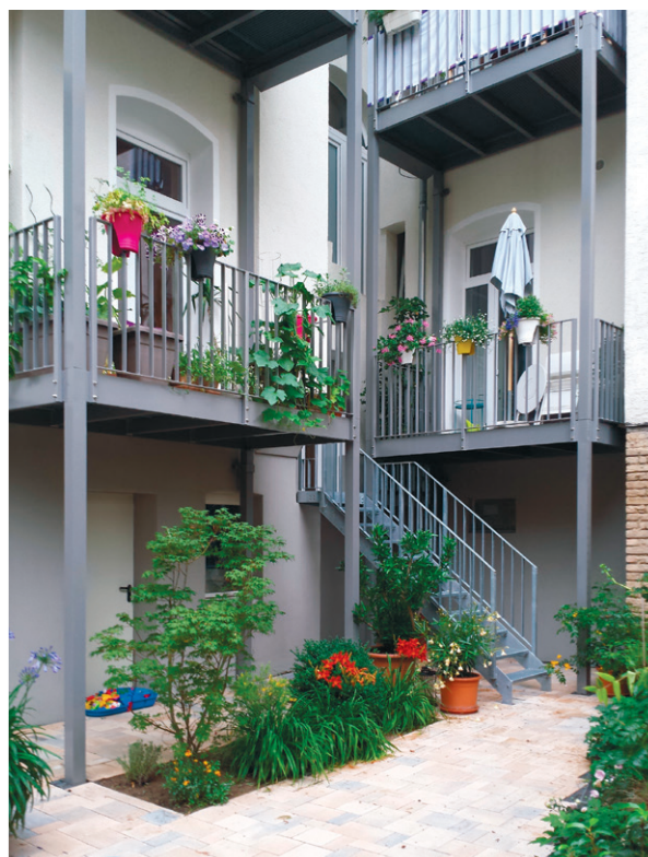
Thermisch getrennte Balkonkonstruktion

Durchgehende Kragplatten aus Beton, wie Balkonplatten oder massive Vordächer, stellen eine deutliche Wärmebrücke dar. Optimal wäre ein Abbruch – falls dies keine Statikprobleme verursacht – und ein Neuaufbau mit einer thermisch getrennten Konstruktion. Der neue Balkon steht dann auf Stützen vor der gedämmten Fassade