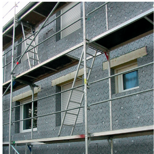
Polystyrolämmung mit Sturzschutz

Wärmedämmverbundsysteme mit Mineralwolle sind im eingebauten Zustand nicht brennbar (Baustoffklasse A*). Systeme mit Polystyrol-Hartschaum können die Baustoffklasse B1 (Schwerentflammbar) erreichen, wenn zusätzliche Brandschutzmaßnahmen getroffen werden. Dafür müssen im Sockelbrandbereich (von Geländeoberkante bis etwa 12 m Höhe) und beim Anschluss an brennbare Dächer mehrere umlaufende Brandriegel eingebaut werden. Dabei handelt es sich um Streifen aus nicht brennbarer Mineralwolle mit einer Höhe von mindestens 20 cm. Bei einer Dämmdicke von mehr als 10 cm muss, je nach Gebäudehöhe, zusätzlich ein Brandriegel oder ein Sturzschutz über den Fenstern eingebaut werden. Vorhandene Brandwände müssen in jedem Fall mit nicht brennbarem Material gedämmt werden.