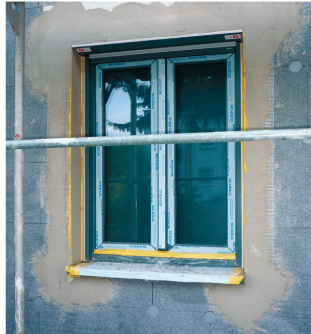
Armierungsgewebe im Fensterbereich

An allen Außenecken sollten Gewebewinkel oder Kantenschutzprofile angebracht werden. Sie dienen zur Verstärkung der Ecken gegen Beschädigungen und erleichtern die Ausbildung einer exakten Kante. Zusätzlich werden an den Ecken von Fenstern und Türen Diagonalestreifen aus Armierungsgewebe angebracht.