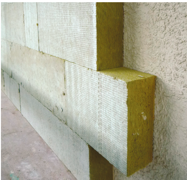
Korrekte Verlegung der Dämmplatten

Die Dämmplatten müssen dicht und möglichst passgenau verlegt werden. Sie werden immer im Verband gesetzt und an den Ecken verzahnt. Kreuzfugen sind nicht zulässig! An überbrückbaren Rissen oder Fugen (wie bei Ausfachungen) dürfen keine Plattenstöße angeordnet werden, sondern sie sollten mit durchgängigen Platten überbrückt werden. Gebäudetrennfugen müssen allerdings auch im Wärmedämmverbundsystem mit einem speziellen Profil getrennt werden.